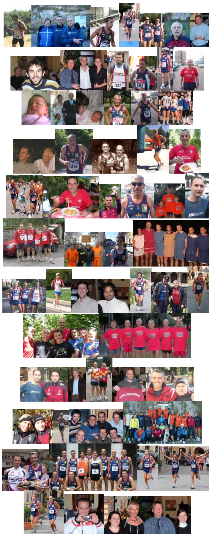
Foto ricordo 2008